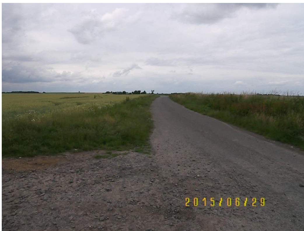
Obr. č. 1 Rozcestí ulice Hillova (T001) a Nad stromkem (T007)