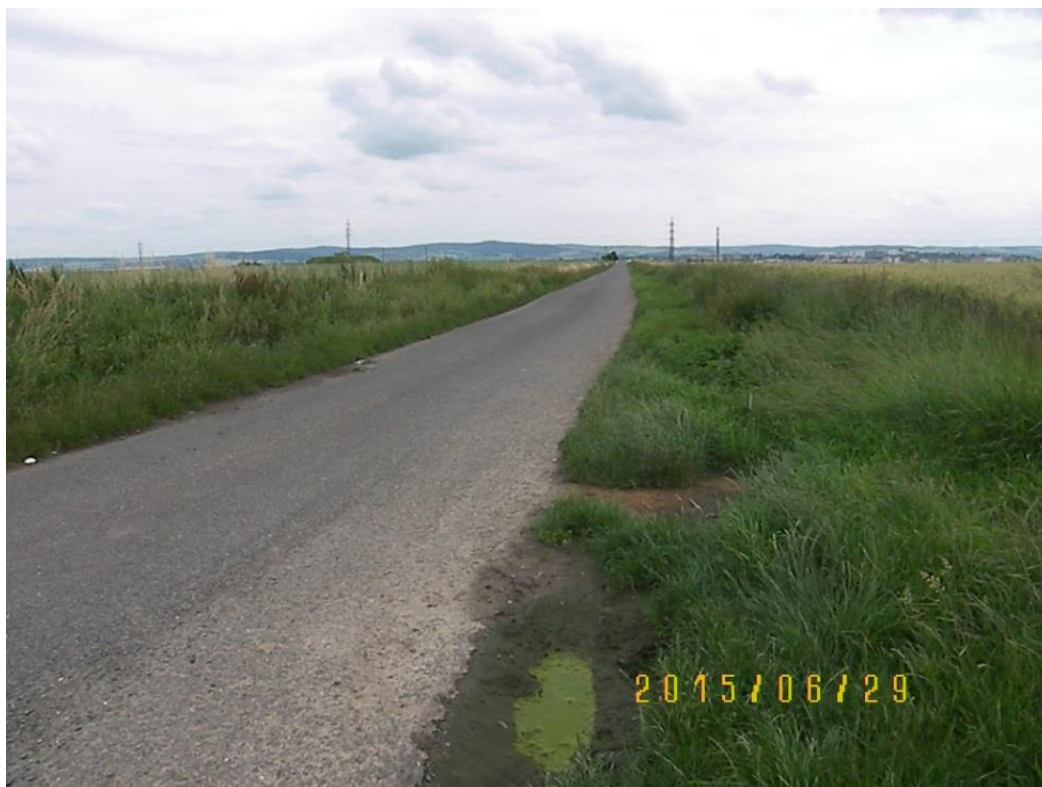
Obr. č. 2 Ulice Hillova